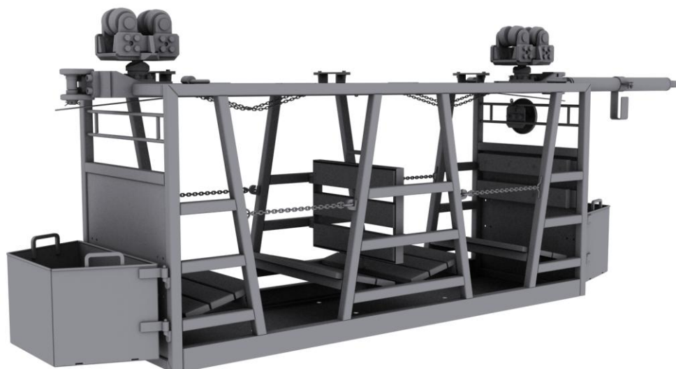
Rys. 1. Model 3D kabiny do przewozu osób

Analizę ergonomiczną wykonano z wykorzystaniem oprogramowania Anthropos Ergomax [1]. Dla odwzorowania sylwetek pasażerów przyjęto model 50-percentylowy, o wymiarach charakterystycznych dla 50% procent populacji mężczyzn [2].